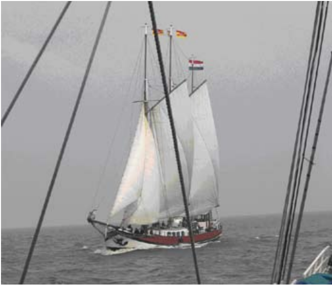
Unsere Konkurrenz auf Gegenkurs

achten. Aber im Nachhinein hat jeder da mit angefasst, wo eine Hand gebraucht wurde.